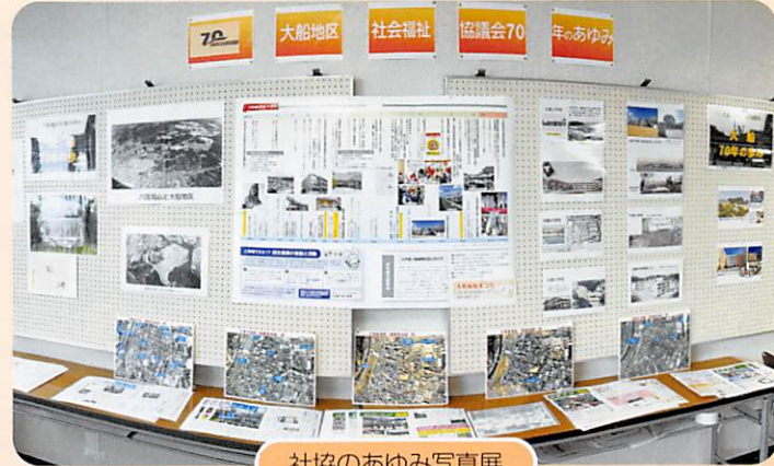
社協のあゆみ写真展