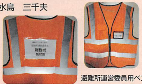
避難所運営委員用ベスト

2024年から2025年にかけて、マニュアル初版2018年2月25日制定の検証を行ってきた結果、2025年12月1日改訂2版として検証を完了しました。今後は、改訂2版を用いて避難所開設訓練を実施する予定。今回の改訂の主な点は、避難所に駆けつけた経験の無い方誰でもが開設運営に携わることができるよう手順と役割分担を分かり易く一覧にまとめたことです。また、大船中学校区は、避難所運営委員の確認とマニュアル検証、開設訓練を推進中です。